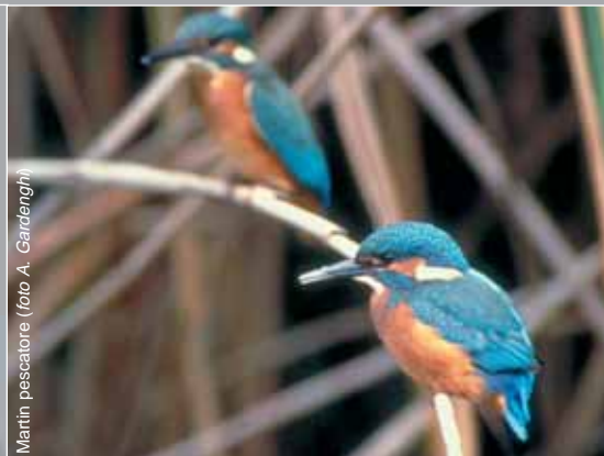
Martin pescatore

Le specie citate sono solo alcune di quelle che frequentano l'area: un occhio attento e paziente potrà sicuramente fare tante altre osservazioni.