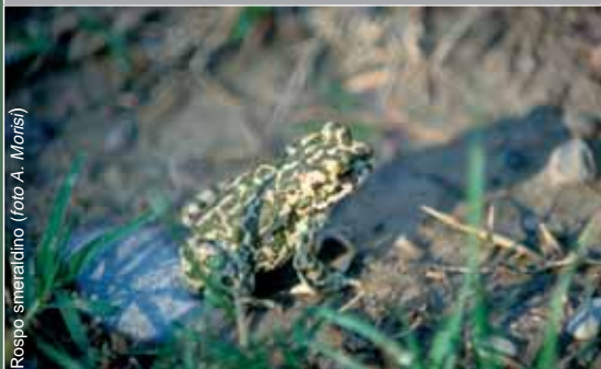
Rospo smeraldino

Gli Uccelli rappresentano una delle principali attrattive dell'area e in tutti i mesi dell'anno è possibile osservare numerose specie, alcune delle quali rare, che trovano nei bacini, nei prati e nelle aree rimboschite una possibilità di sosta e alimentazione. Altre vi trovano un luogo tranquillo dove nidificare.